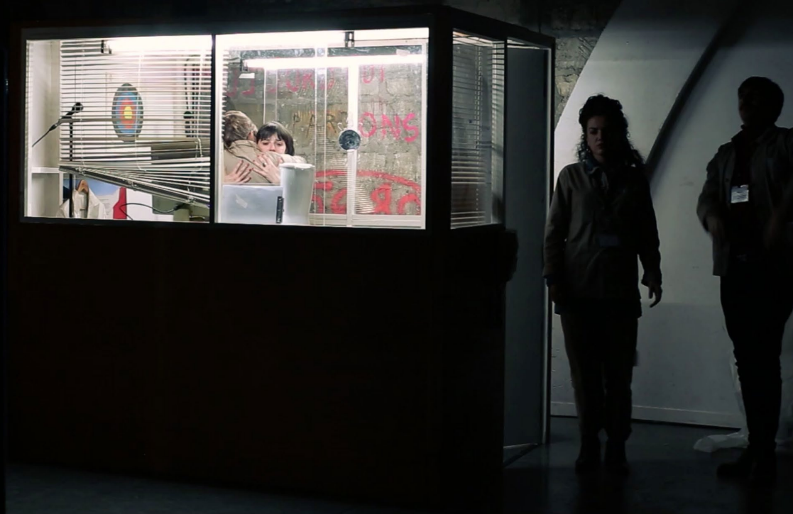
La cabine médiateurs, captation du 05/02/21